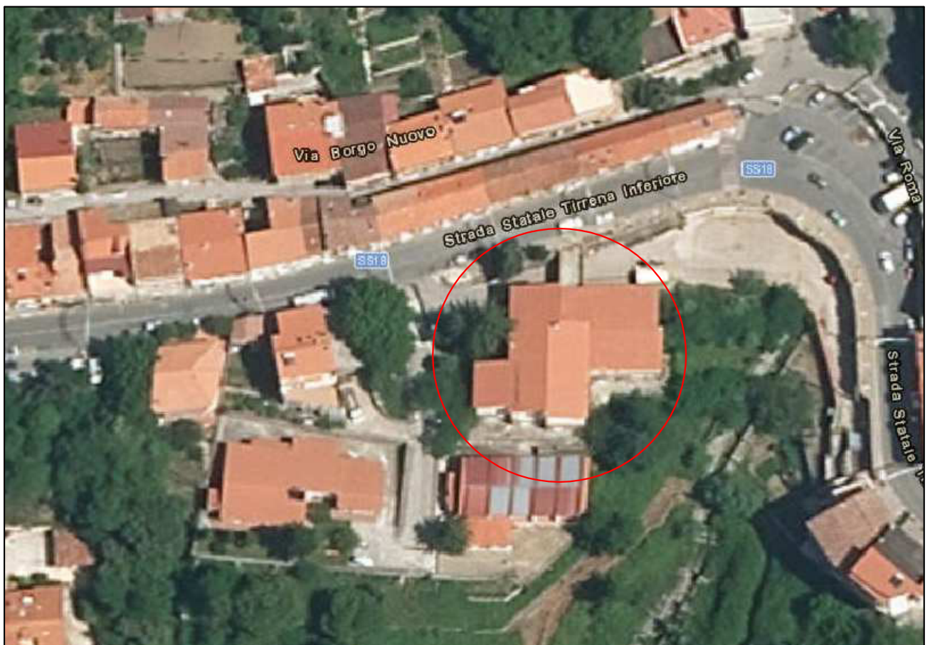
Stralcio dall'ortofoto Sc. 1:1000