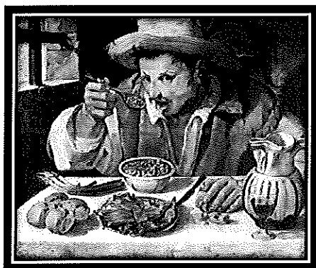
Annibale Carracci - Il mangiafagioli (1583 ca.)

PROGETTO DI RETE F-3-FSE04_POR_CAMPANIA-2013-206 TITOLO DEL PERCORSO